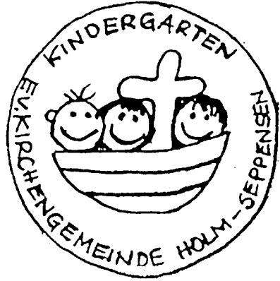
Imse Wimse Spinne

Imse Wimse Spinne, wie lang dein Faden ist. Kam der Regen runter, und der Faden riss. Kam die liebe Sonne, leckt den Regen auf. Imse Wimse Spinne klettert wieder rauf.